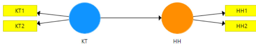
Gambar 1. Skema Analisis SEM Kemampuan Tahfidz (KT/ x ) terhadap Huruf Hijaiyah (HH/ y )

Setelah melalui uji validitas dan reliabilitas, lembar tes diserahkan dan diisi oleh guru dengan menyesuaikan jawaban anak saat dilakukan pengukuran. Pengukuran anak dilakukan dalam 1 kali tes. Penilaian hasil jawaban anak, dibagi dalam 4 skala. Skala 1 terendah dan skala 4 tertinggi. Pengukuran dalam penelitian ini, berkolaborasi dengan guru dan peneliti sebagai observer. Kemudian data anak dianalisis menggunakan structural equation model partial least square (SEM-PLS). SEM-PLS ditetapkan sebagai analisis data anak dikarenakan jenis data penelitian yang bersifat ordinal dan berjumlah kecil. Lebih lanjut mengenai analisis SEM-PLS yang digunakan, tersaji pada gambar 1.