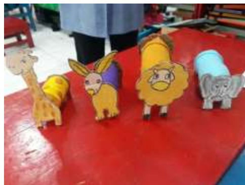
Gambar 5. Bagian depan boneka hewan yang sudah jadi

Setelah menggunting, dibantu oleh guru, anak menempel kain tersebut pada botol bekas. Setelah selesai menempel kain, anak kemudian menempel gambar wajah hewan pada bagian atas botol atau bagian tutup botol dan bagian ekor hewan pada bagian bawah botol yang sebelumnya sudah ditempel di kardus dan digunting. Ketika menempel, anak dibantu oleh guru agar menyesuaikan posisi dari boneka hewan tersebut sehingga boneka hewan tersebut dapat berdiri.