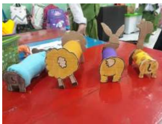
Gambar 6. Bagian belakang boneka hewan yang sudah jadi

Setelah menggunting, dibantu oleh guru, anak menempel kain tersebut pada botol bekas. Setelah selesai menempel kain, anak kemudian menempel gambar wajah hewan pada bagian atas botol atau bagian tutup botol dan bagian ekor hewan pada bagian bawah botol yang sebelumnya sudah ditempel di kardus dan digunting. Ketika menempel, anak dibantu oleh guru agar menyesuaikan posisi dari boneka hewan tersebut sehingga boneka hewan tersebut dapat berdiri.