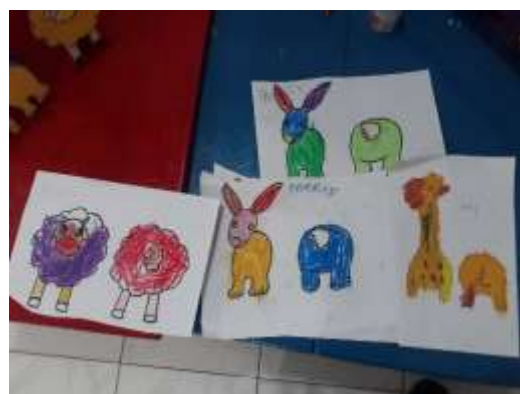
Gambar 3. Gambar hewan yang telah diwarnai oleh anak-anak

Setelah mengumpulkan botol, guru memberi anak kertas bergambar wajah hewan yang juga sudah termasuk kaki depan dan bagian ekor hewan yang sudah termasuk kaki bagian belakang. Anak-anak mewarnai gambar tersebut menggunakan krayon dan pensil