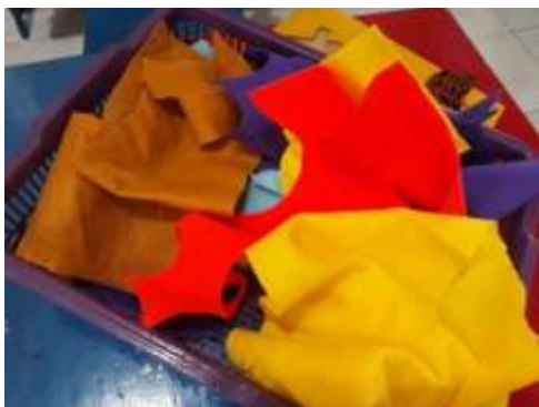
Gambar 4. Kain flanel yang digunakan untuk membungkus botol bekas

Kemudian, setelah guru membantu anak menggunting kardus, anak-anak menggunting kain flanel atau kain perca yang akan digunakan untuk membungkus botol bekas. Di bawah bimbingan guru, anak mengukur lebar dan diameter botol kemudian menggunting kain flanel atau kain perca sesuai dengan ukuran botol ( gambar 4 ).