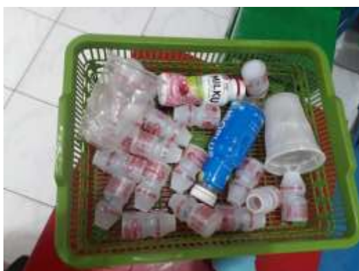
Gambar 2. Botol-botol bekas yang dibawa anak dan sudah dibersihkan

Sebelum memulai kegiatan membuat boneka hewan, guru menunjukkan contoh boneka hewan yang sudah jadi kepada anak. Guru mengajak anak melakukan tanya jawab terkait boneka hewan tersebut. Guru menunjukkan bagian-bagian pada boneka hewan dan memberi tahu pada anak cara membuatnya. Setelah anak-anak siap, guru mengajak anak mencuci botol-botol tersebut dan mengumpulkannya dalam keranjang ( gambar 2 ).