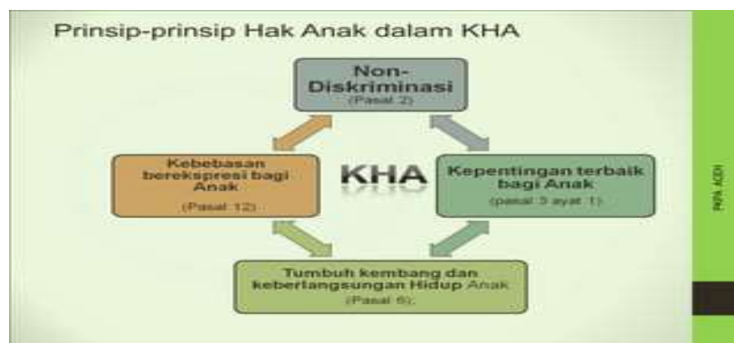
Gambar 1. Prinsip-prinsip Hak Anak dalam KHA.

Menurut undang-undang Hak Alami, anak-anak yang bermain sebenarnya dilindungi, didalam 31 Hak Konvensi Anak disebutkan bahwa : “Hak anak untuk beristirahat, bersantai, bermain dan berpartisipasi dalam kepentingan budaya dan seni (PPPA, 2015). Melalui bermain, anak mendapatkan beraneka keuntungan positif baik itu dari segi fisik-motorik, kapabilitas juga perkembangan sosio-emosional (Wiwik, 2017). Dengan bermain, anak mendapatkan pengalaman emosi yang berbeda-beda, seperti senang, sedih, bersemangat, kecewa, bangga, marah (Ardini, 2018). Dengan bantuan bermain, anak juga memahami hubungan antara dirinya sendiri dengan lingkungan sosialnya, dengan belajar bersosialisasi serta memahami aturan atau adat istiadat dalam berinteraksi sosial (Wahyuni, 2020). Dalam UU No. 23 Tahun 2002 tentang Perlindungan Anak bahwa pemerintah menjamin kesejahteraan tiap-tiap warganya termasuk perlindungan terhadap prinsip-prinsip hak anak yang merupakan hak azazi manusia. Prinsip tersebut dapat dilihat pada gambar 1.