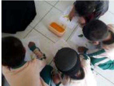
Gambar 3. Mencetak bunga dari warna dan daun