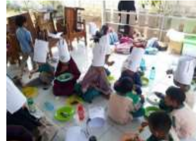
Gambar 4. Kegiatan cooking class tema makanan sehat

Dalam konteks penyusunan Rencana Kegiatan Mingguan (RKM) di Rencana Kegiatan Harian (RKH), para guru menyusun materi ajar dengan mengikuti pedoman yang telah ditetapkan, untuk memastikan bahwa tidak ada materi atau peralatan yang melompati tingkat kesulitan yang ditentukan. Konsistensi dalam penyusunan materi ini tercermin dalam penyusunan Rencana Kegiatan Harian oleh guru, yang selalu mengacu pada Rencana Kegiatan Mingguan yang telah ditetapkan.