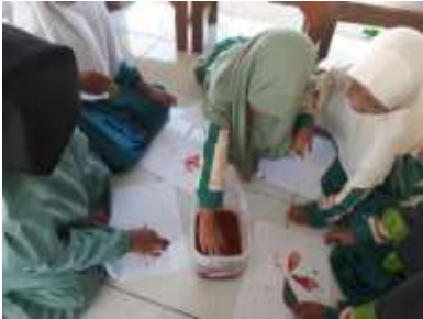
Gambar 2. Mencetak bunga dari warna dan daun

Materi utama dalam pendekatan ini bersumber dari bahan-bahan alam seperti tanah, air, pasir, batu, daun, dan biji (Nurjanah & Muthmainah, 2023). Seluruh bahan dan peralatan yang digunakan dipastikan aman, bersih, dan bebas dari zat beracun atau potensi bahaya bagi anak-anak. Sebagaimana dapat dilihat dari data dokumentasi kegiatan pada gambar 2, gambar 3 dan gambar 4.