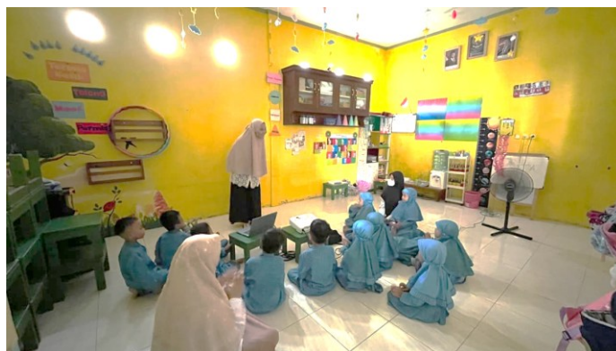
Gambar 2. Tahap Persiapan Pembelajaran Menggunakan Media Video

Tahap persiapan diawali dengan kegiatan guru menyiapkan media video pembelajaran yang disesuaikan dengan tema dan tujuan pembelajaran. Guru memberikan pengantar singkat, menyampaikan aturan selama kegiatan menonton, serta mengondisikan posisi duduk anak agar siap mengikuti pembelajaran. Pada tahap ini, indikator kemampuan menyimak yang paling tampak berkembang adalah kemampuan mendengar dan memperhatikan, karena anak mulai dilatih untuk fokus terhadap arahan awal yang disampaikan guru. Tahap persiapan pembelajaran menggunakan media video ditampilkan pada Gambar 2.