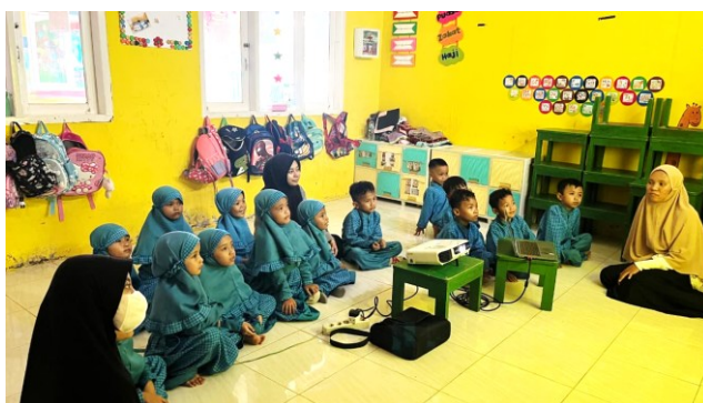
Gambar 3. Pelaksanaan Pembelajaran Melalui Media Video

Anak dengan kemampuan menyimak tinggi mampu memperhatikan tayangan video secara konsisten dari awal hingga akhir serta memahami isi video dengan baik. Anak dengan kemampuan menyimak sedang menunjukkan konsentrasi yang belum stabil, namun masih dapat menangkap inti informasi yang disampaikan. Sebaliknya, anak dengan kemampuan menyimak rendah mengalami kesulitan mempertahankan perhatian dan belum mampu memahami isi video secara menyeluruh tanpa pendampingan intensif dari guru. Pelaksanaan pembelajaran melalui media video ditunjukkan pada Gambar 3.