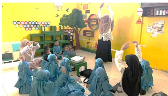
Gambar 4. Kegiatan Tindak Lanjut Pembelajaran Setelah Pemutaran Video

Tahap tindak lanjut dilaksanakan setelah video selesai diputar melalui kegiatan diskusi, tanya jawab, serta permintaan kepada anak untuk menceritakan kembali isi video. Guru memberikan penguatan dan klarifikasi terhadap jawaban anak agar pemahaman yang diperoleh menjadi lebih tepat. Pada tahap ini, indikator kemampuan menyimak yang berkembang adalah kemampuan memahami dan menanggapi. Kegiatan tindak lanjut pembelajaran setelah pemutaran video ditampilkan pada Gambar 4.