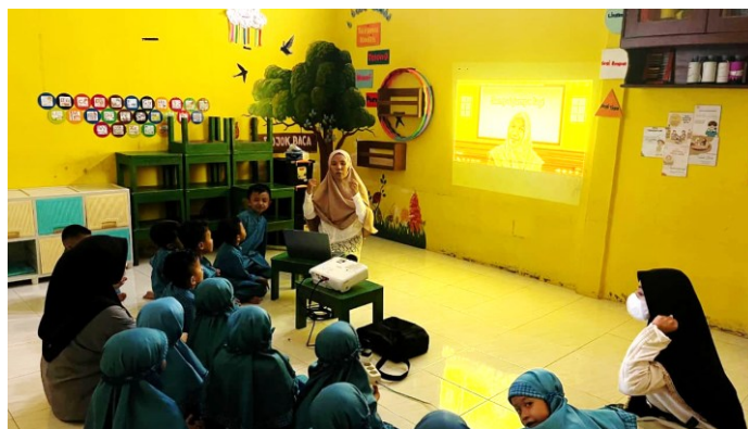
Gambar 5. Aktivitas Anak dalam Menanggapi Isi Video Pembelajaran

Solusi yang dilakukan berupa pendampingan yang disesuaikan dengan kebutuhan masing-masing anak serta pemberian kegiatan lanjutan seperti tanya jawab sederhana dan aktivitas ringan. Pendekatan ini membantu anak dengan kemampuan menyimak rendah untuk berlatih secara bertahap, sekaligus memberikan ruang bagi anak dengan kemampuan menyimak tinggi untuk terus mengembangkan potensinya. Aktivitas anak dalam menanggapi isi video pembelajaran ditampilkan pada Gambar 5.